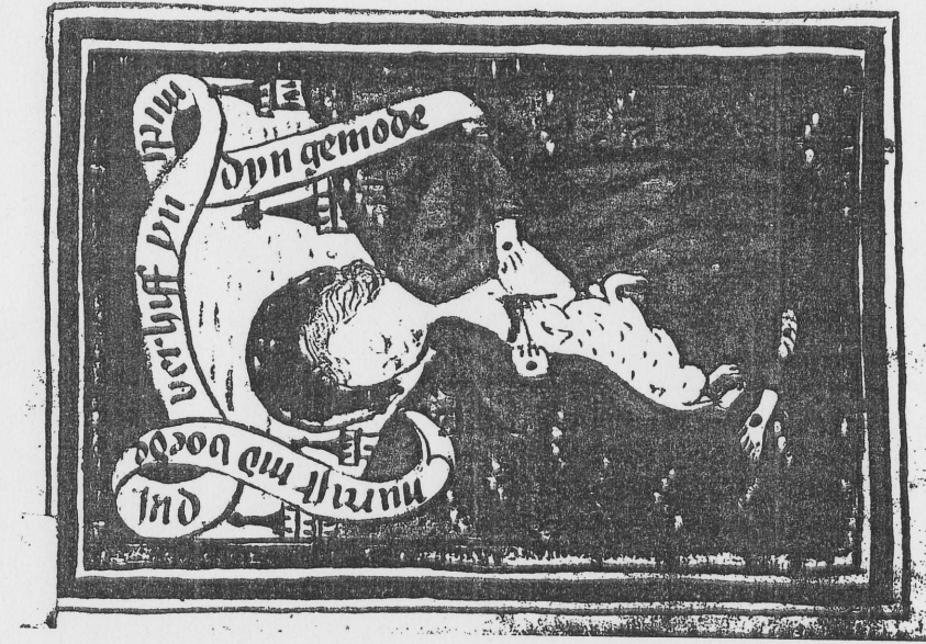
Berlin, Staatsbibliothek PK Ms. germ. oct. 451, 30v Köln-Kartause Gebetbuch, Bild zu den Horen der Ewigen Weis-Seuses