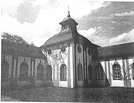
Die Kartause Buxheim