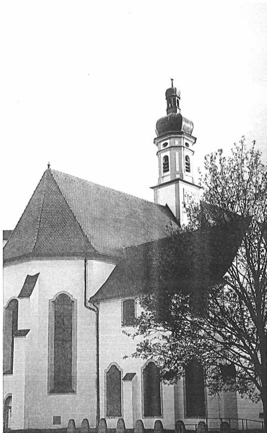
Kartause Buxheim

Buxheim 1402-1812 - Observanz und Bibliothek Ludolph of Saxony, Vita Christi