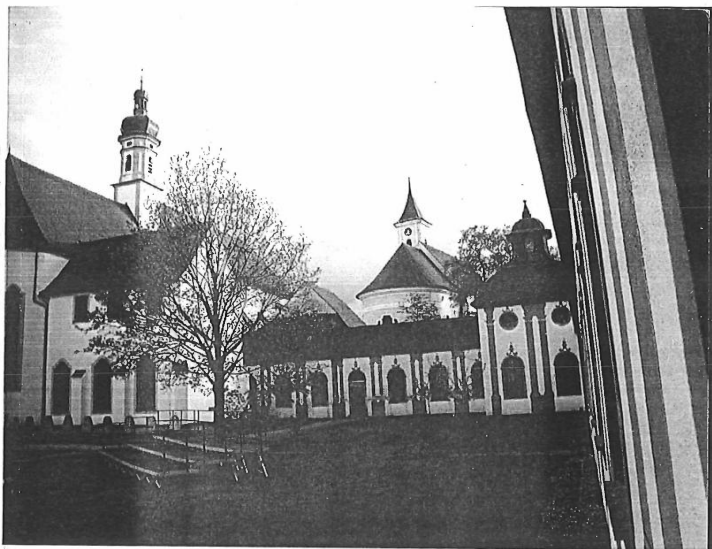
Die Kartause Buxheim

Buxheim 1402-1812 - Observanz und Bibliothek Ludolph of Saxony, Vita Christi