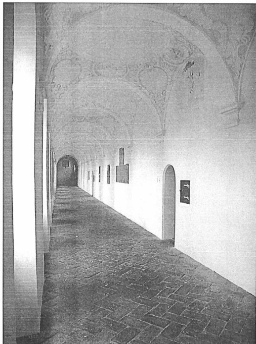
Kartause Buxheim: Kreuzgang (Photo: Juan Mayo Escudero)

Sulpice, Classiques Français du Moyen Age 173 (review); Analecta Cartusiana 1970-2014; 2014