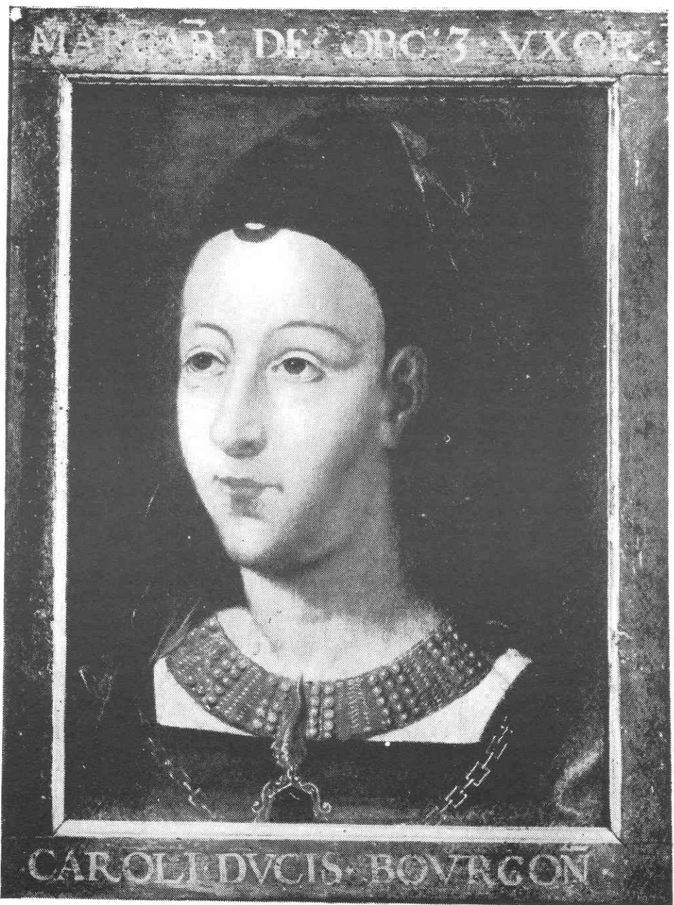
MARGARETA VAN YORK (huidige verblijfplaats onbekend) uit "3 portraits de la maison de Bourgogne". RUBRECHT, Brugge, 1910.