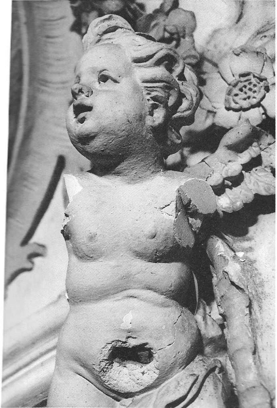
6 Kartäuserkirche Ittingen, Putto der Gebr. Gigl, 1763. Sprengwirkungen der gerosteten Armierung.