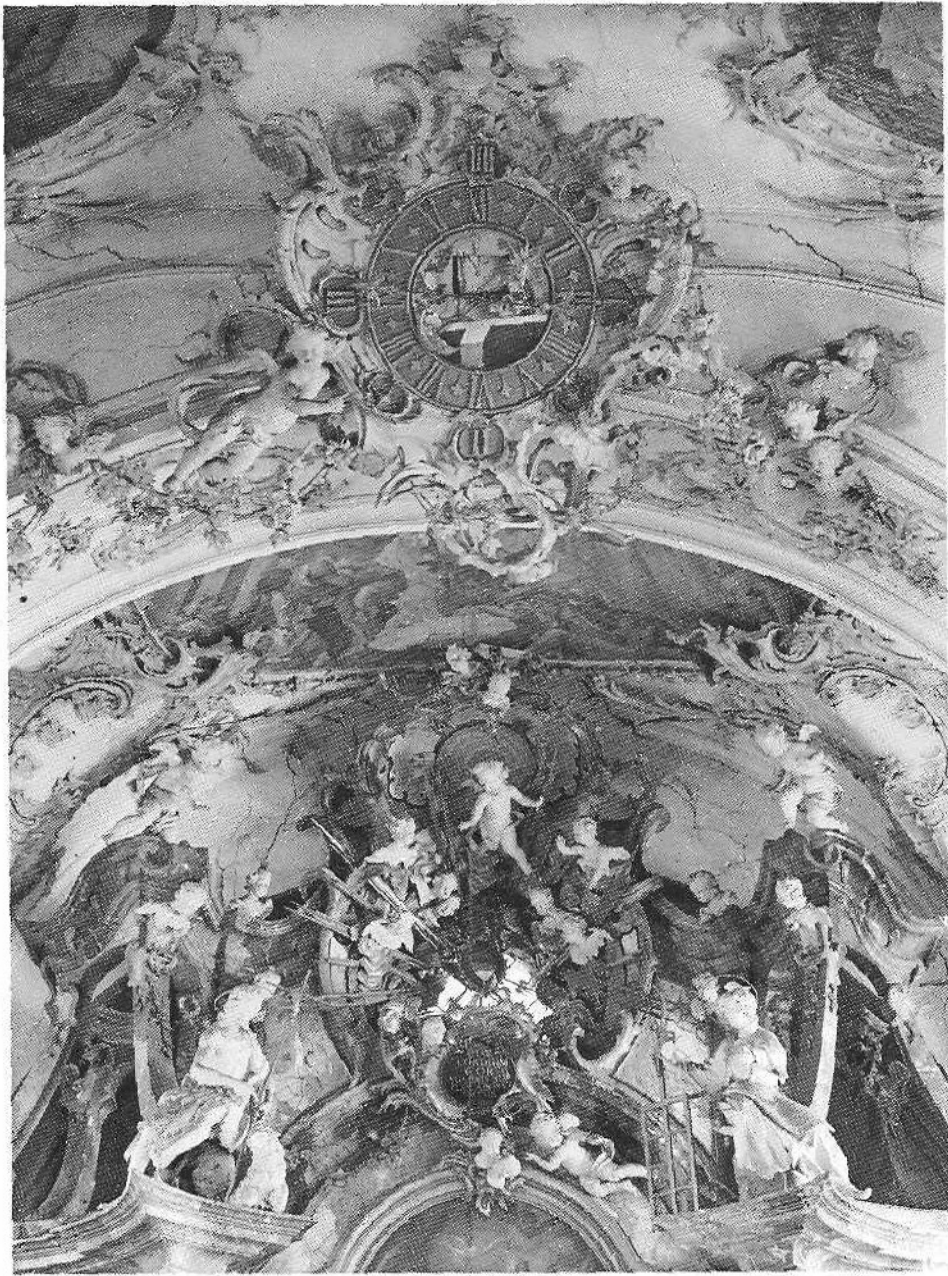
85 Kartäuserkirche Ittingen vor der Restaurierung.