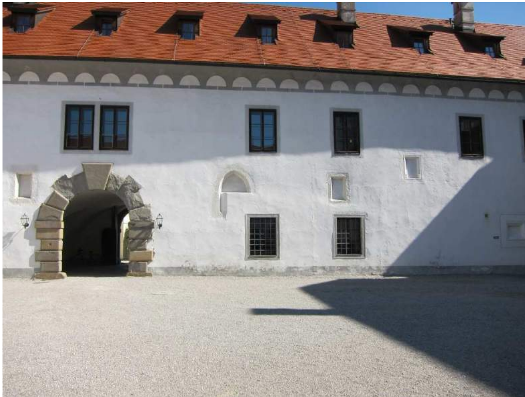
Abbildung 56: Gaming, ehemalige Kartause, Prälatenhof, Nordtrakt mit Durchfahrt und vermauerten Fenstern, Blick von Süden.