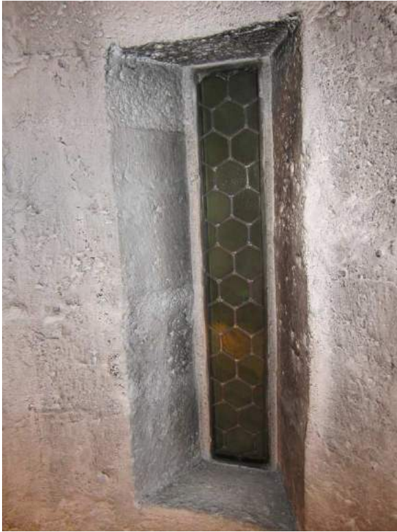
Abbildung 94: Gaming, ehemalige Kartause, Kirche, Südkapelle, Wendeltreppe, vermauertes Fenster.