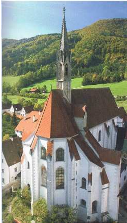
Abbildung 67: Gaming, ehemalige Kartause, Ansicht des Kirchenchores mit Dachreiter, Blick von Nordosten.