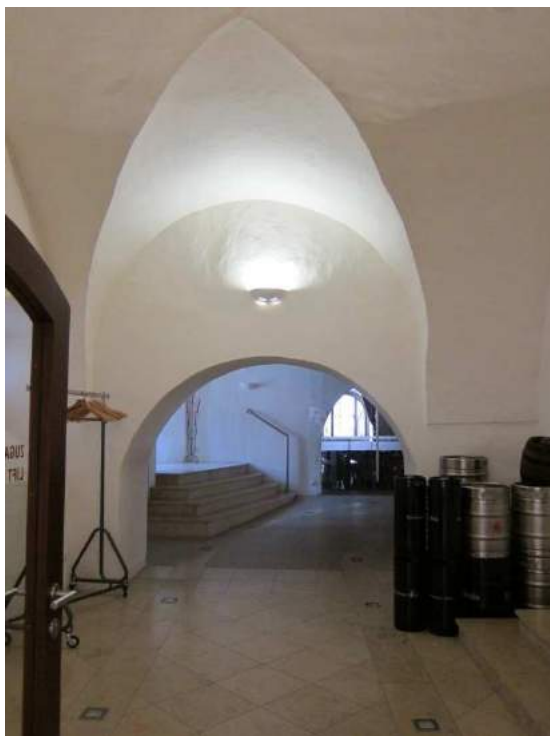
Abbildung 59: Gaming, ehemalige Kartause, Prälatenhof, südlicher Osttrakt, innen, Erdgeschoß mit Kreuzgratgewölbe.