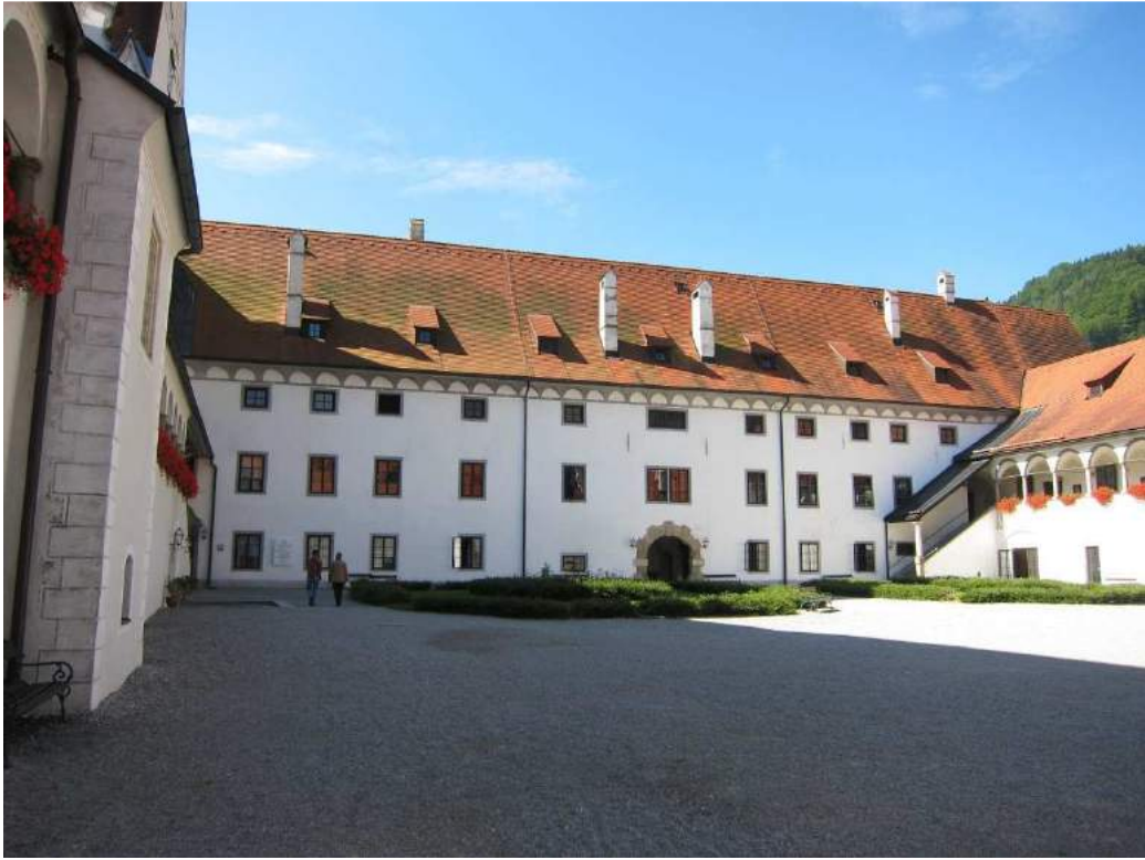
Abbildung 49: Gaming, ehemalige Kartause, Prälathof, Südtrakt, Ansicht von Norden.