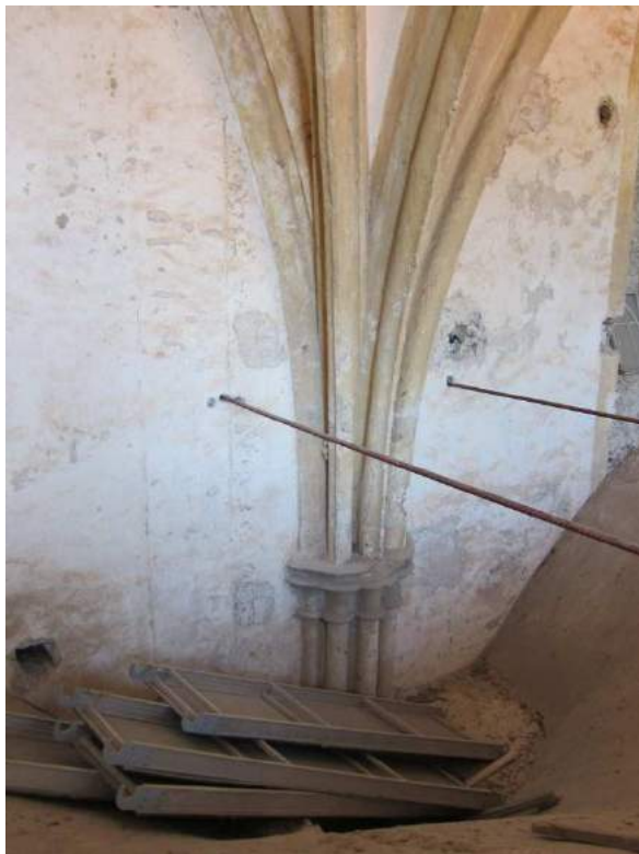
Abbildung 79: Gaming, ehemalige Kartause, Kirche, Zwischengewölbe, Kämpferzone.