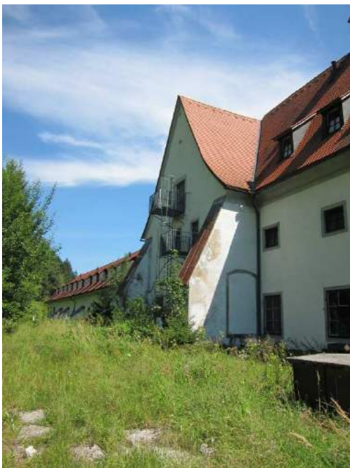
Abbildung 65: Gaming, ehemalige Kartause, Prälatenhof, Westfassade des Südtraktes, Blick von Südwesten.