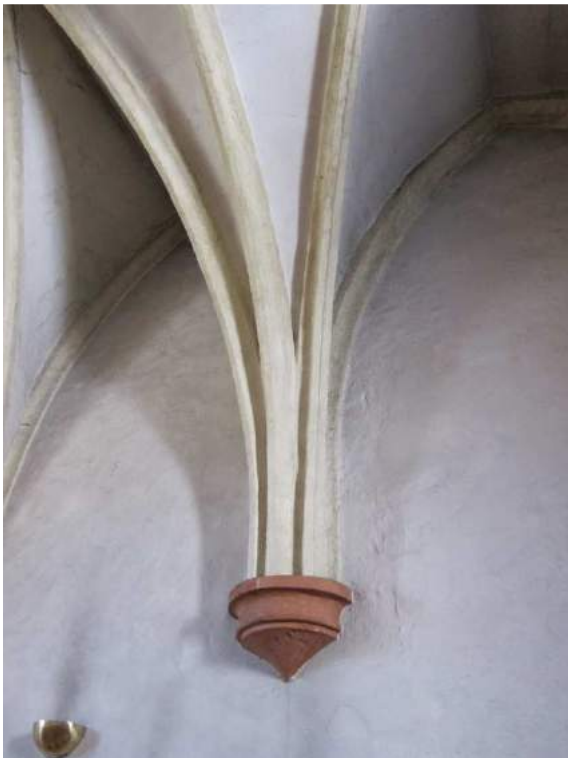
Abbildung 97: Gaming, ehemalige Kartause, Kirche, Südkapelle, Obergeschoß, innen, Südwand, Konsole.