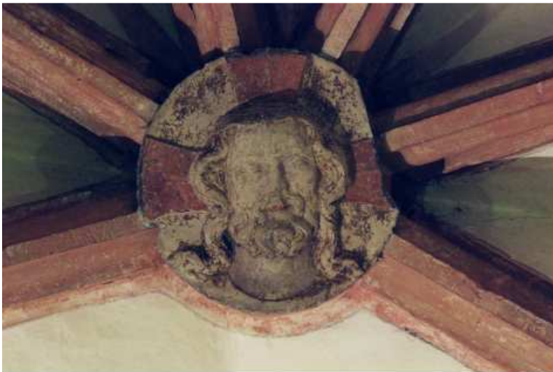
Abbildung 93: Gaming, ehemalige Kartause, Kirche, Südkapelle, Erdgeschoß (ehemaliger Kapitelsaal), innen, Detail Schlussstein der Apsis, vor der Restaurierung.