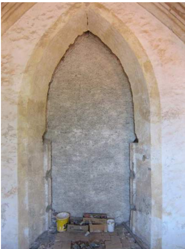
Abbildung 83: Gaming, ehemalige Kartause, Kirche, Zwischengewölbe, südliche Langhauswand, 3. Joch von Westen, vermaueretes spitzbogiges Portal.