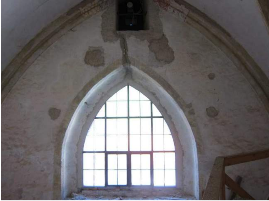
Abbildung 81: Gaming, ehemalige Kartause, Kirche, Zwischengewölbe, Spitzbogenfenster im Osten, Blick von Westen.