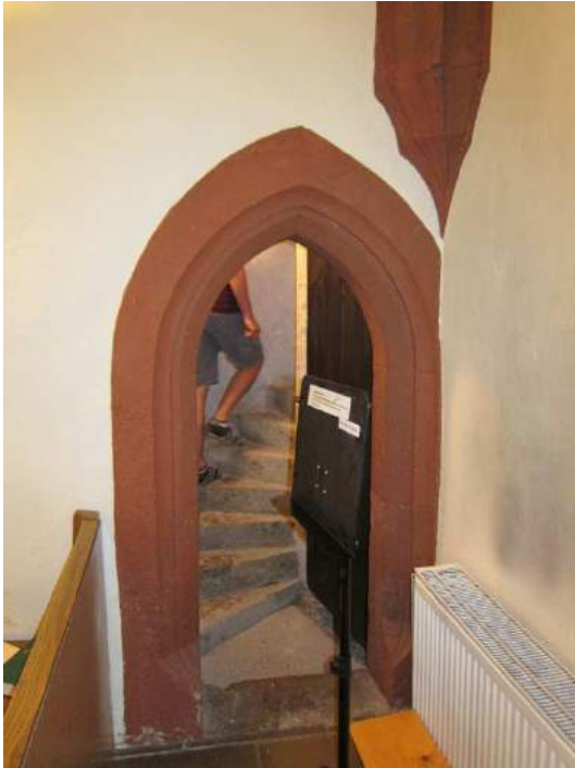
Abbildung 90: Gaming, ehemalige Kartause, Kirche, Südkapelle, Erdgeschoß (ehemaliger Kapitelsaal), innen, Tür zur Wendeltreppe im Südwesten.