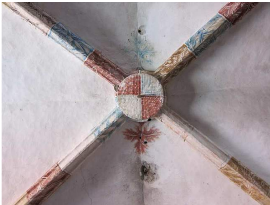
Abbildung 77: Gaming, ehemalige Kartause, Kirche, Zwischengewölbe, 3. Joch von Westen, Schlussstein.