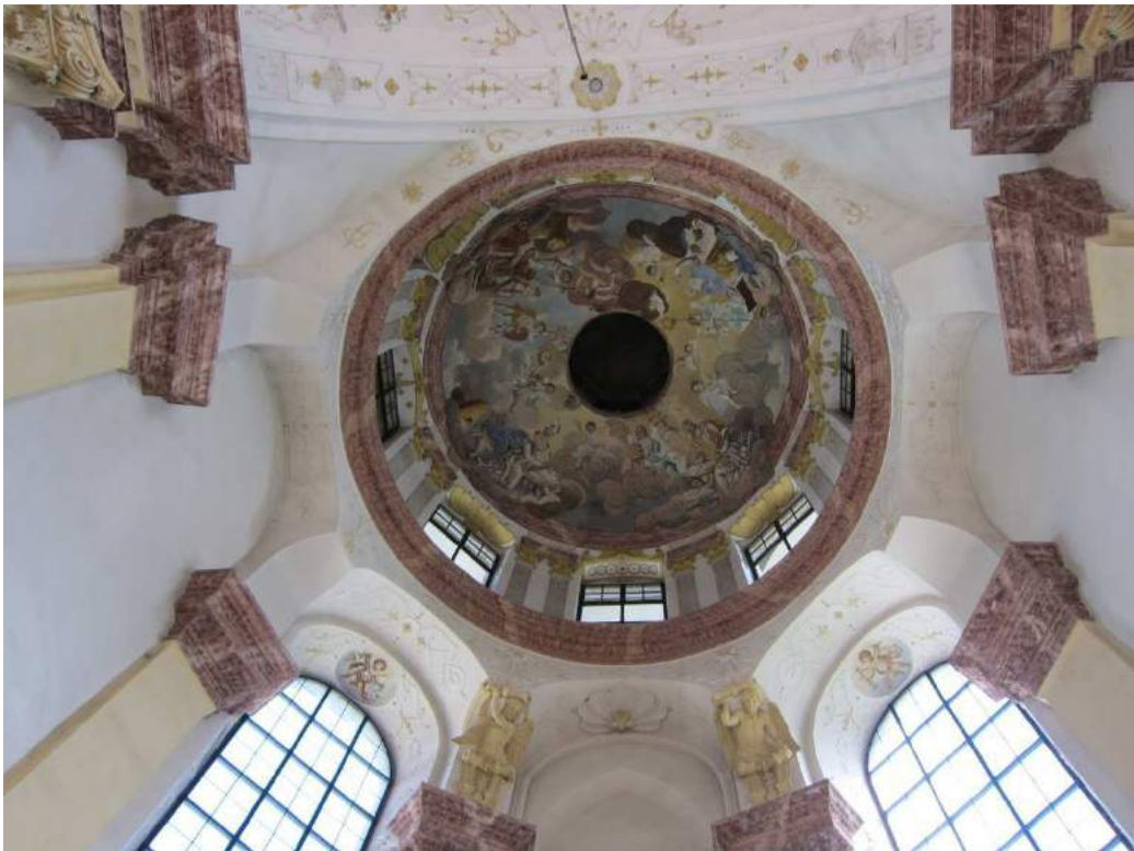
Abbildung 71: Gaming, ehemalige Kartause, Kirche, Chor, Blick in die Kuppel.