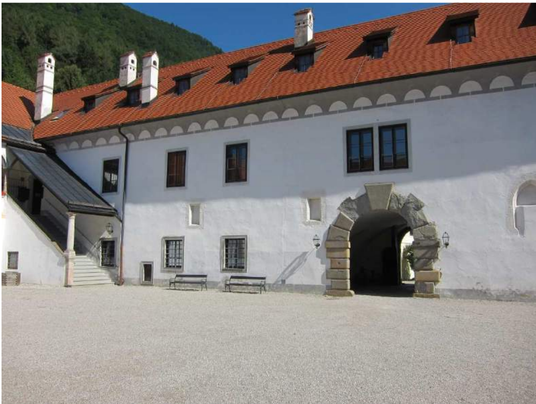
Abbildung 55: Gaming, ehemalige Kartause, Prälatenhof, Nordtrakt mit Durchfahrt und vermauerten Fenstern, Blick von Süden.