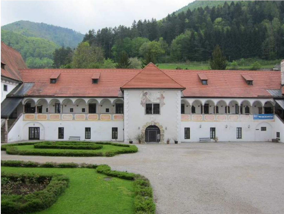
Abbildung 50: Gaming, ehemalige Kartause, Prälathof, Westtrakt, Ansicht von Osten.