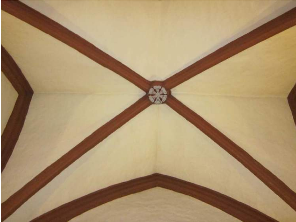
Abbildung 92: Gaming, ehemalige Kartause, Kirche, Südkapelle, Erdgeschoß (ehemaliger Kapitelsaal), innen, Blick ins Gewölbejoch, Schlussstein mit Blütenform.