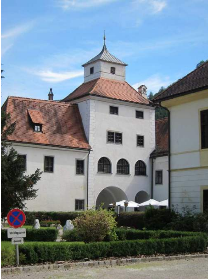
Abbildung 46: Gaming, ehemalige Kartause, Torturm und nördlicher Anbau, Ansicht von Nordwesten.