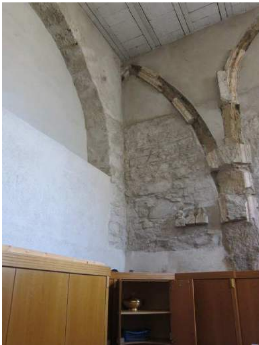
Abbildung 87: Gaming, ehemalige Kartause, Kirche, Nordkapelle (Sakristei), Erdgeschoß, innen, Nordwand, Rippenfragmente, Blick von Süden.