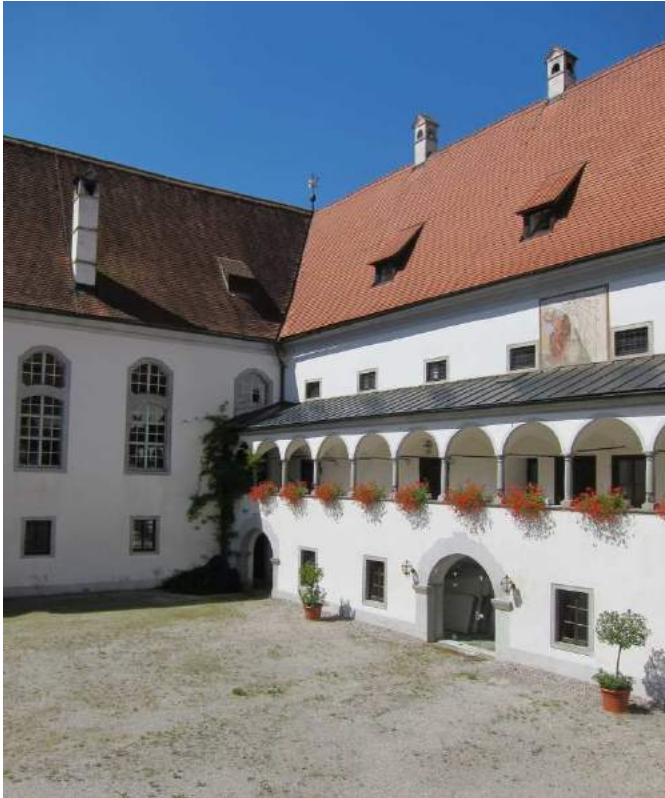
Abbildung 100: Gaming, ehemalige Kartause, Bibliothekshof, West- und Südtrakt (Bibliothek), Blick von Nordosten.