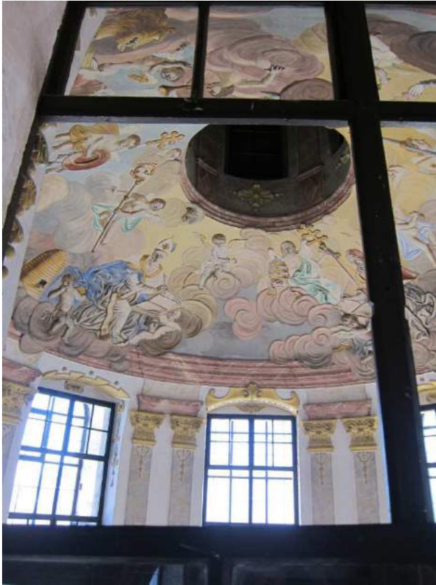
Abbildung 72: Gaming, ehemalige Kartause, Kirche, innen, Blick vom Zwischengewölbe in die Kuppel und Laterne.