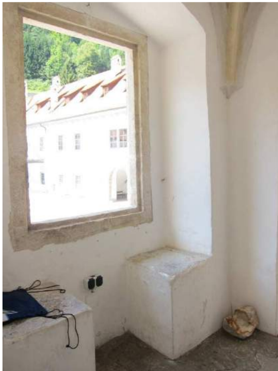
Abbildung 63: Gaming, ehemalige Kartause, Prälatenhof, Osttrakt, risalitartiger Vorsprung, innen, Fensterrahmung und Sitznische.