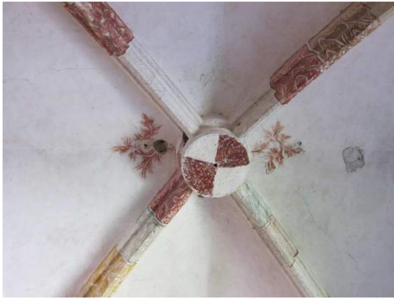
Abbildung 76: Gaming, ehemalige Kartause, Kirche, Zwischengewölbe, 2. Joch von Westen, Schlussstein.