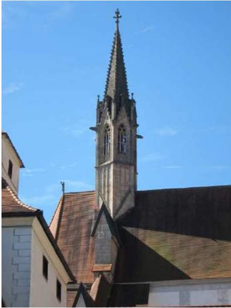
Abbildung 68: Gaming, ehemalige Kartause, Ansicht des Dachreiters der Kirche, Blick von Norden.