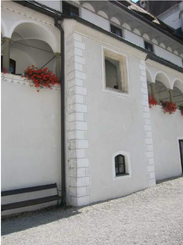
Abbildung 60: Gaming, ehemalige Kartause, Prälatenhof, Osttrakt, risalitartiger Vorsprung, Ansicht von Nordwesten.