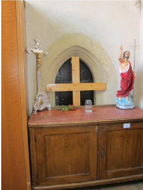
Abbildung 88: Gaming, ehemalige Kartause, Kirche, Nordkapelle (Sakristei), Erdgeschoß, innen, Apsis, Südwand, spitzbogige Tür.