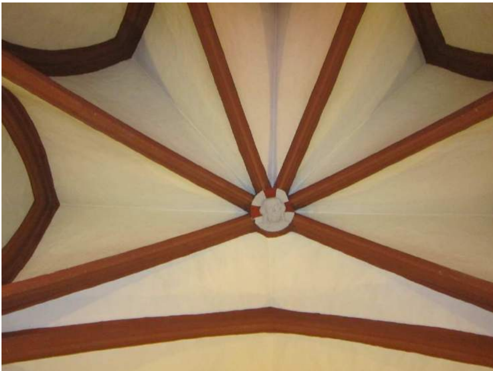
Abbildung 91: Gaming, ehemalige Kartause, Kirche, Südkapelle, Erdgeschoß (ehemaliger Kapitelsaal), innen, Blick ins Apsisgewölbe, Schlussstein mit Christuskopf.