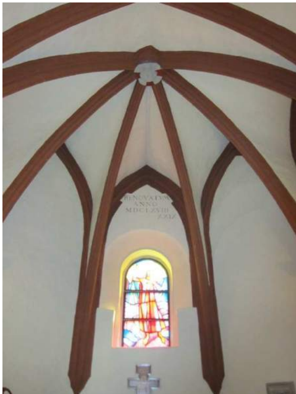
Abbildung 89: Gaming, ehemalige Kartause, Kirche, Südkapelle, Erdgeschoß (ehemaliger Kapitelsaal), innen, Apsis.