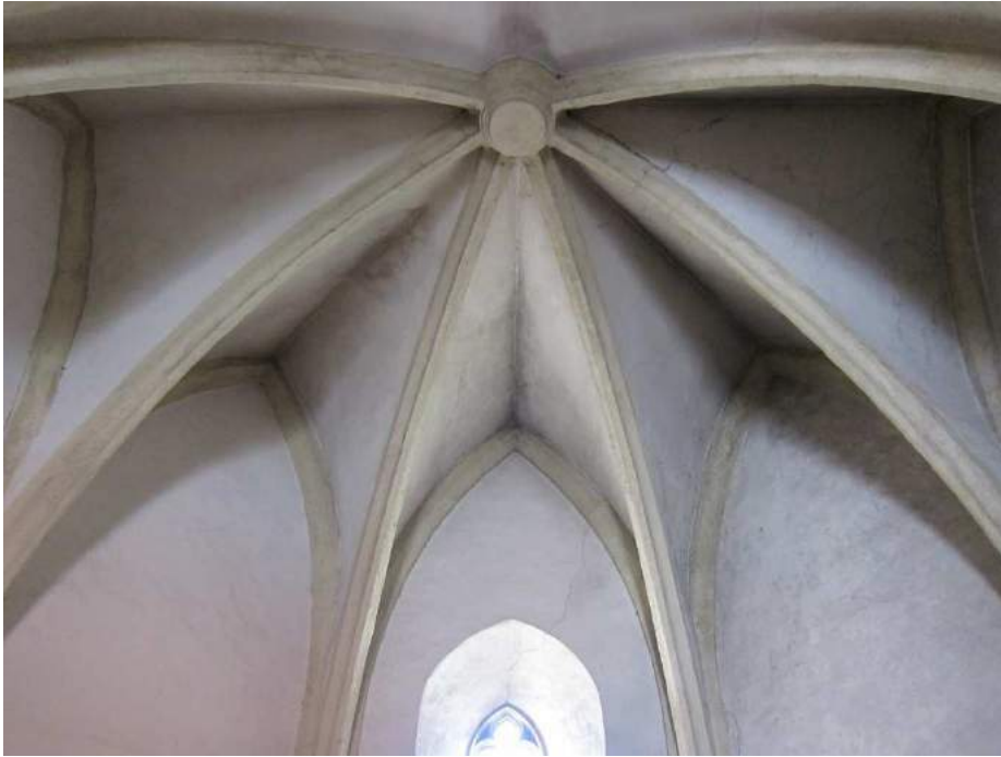
Abbildung 96: Gaming, ehemalige Kartause, Kirche, Südkapelle, Obergeschoß, innen, Blick ins Apsisgewölbe, Blick von Westen.