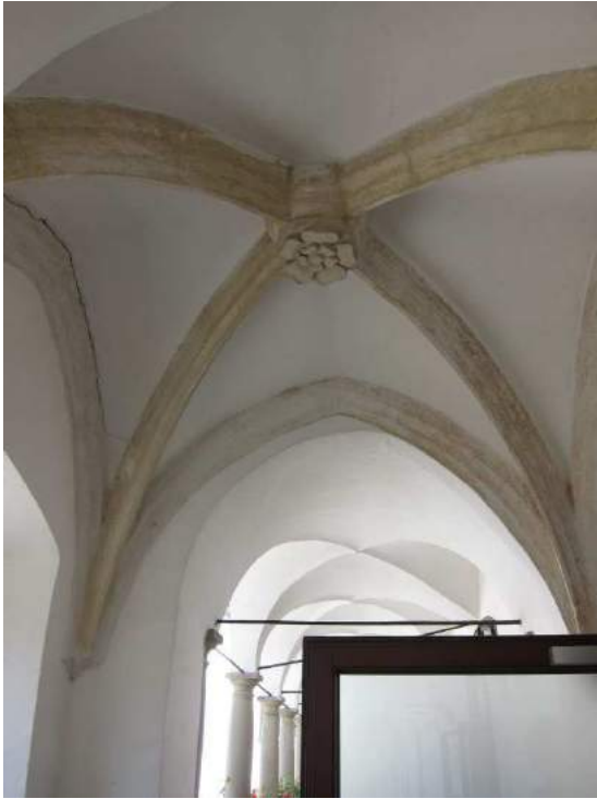
Abbildung 64: Gaming, ehemalige Kartause, Prälatenhof, Osttrakt, risalitartiger Vorsprung, innen, Kreuzrippengewölbe mit Blütenschlussstein.