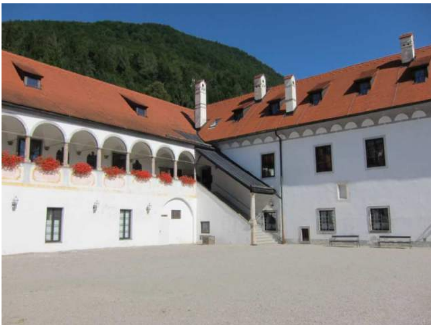
Abbildung 47: Gaming, ehemalige Kartause, Prälatenhof, Nord- und Westtrakt, Ansicht von Südosten.