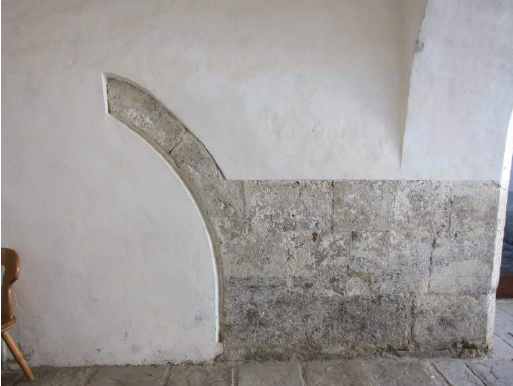
Abbildung 54: Gaming, ehemalige Kartause, Prälatenhof, Durchfahrt im Westen, Bogenrest an der Südwand.