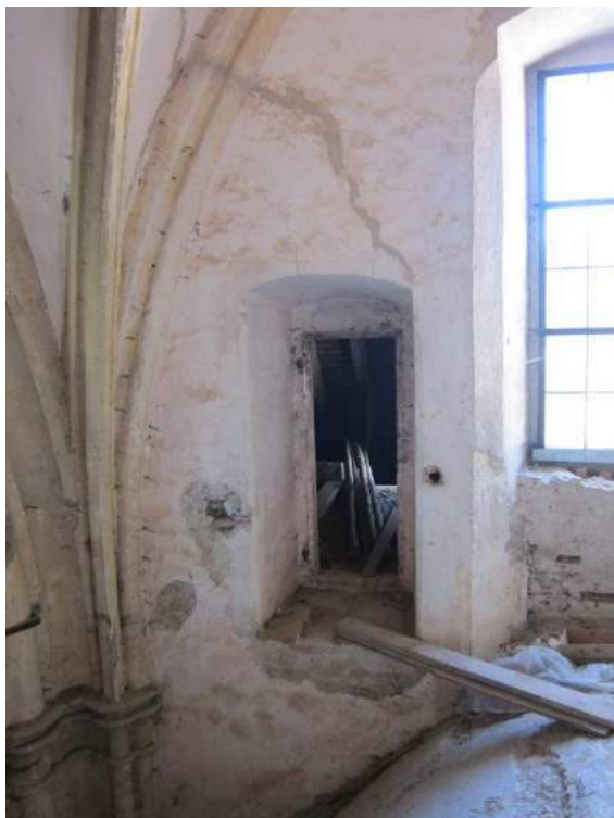
Abbildung 85: Gaming, ehemalige Kartause, Kirche, Zwischengewölbe, südliche Langhauswand, 4. Joch von Westen, Türöffnung.