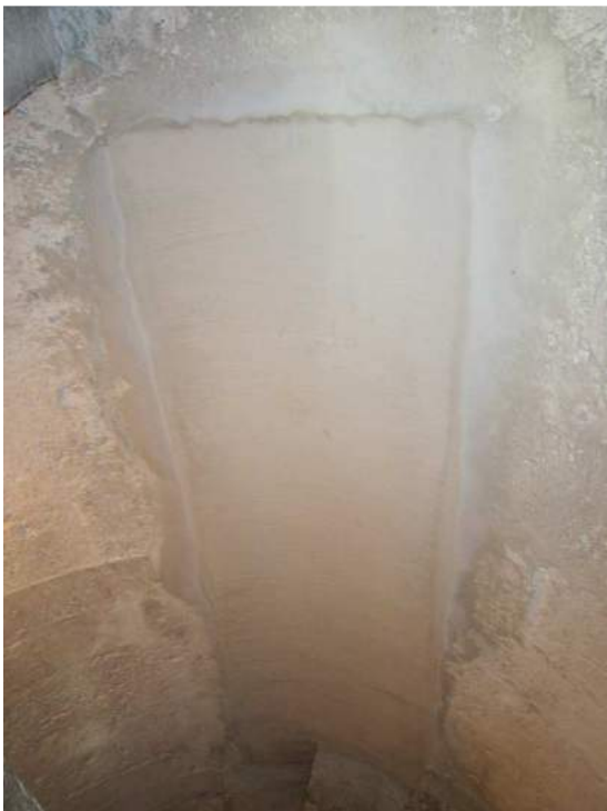
Abbildung 95: Gaming, ehemalige Kartause, Kirche, Südkapelle, Wendeltreppe, vermauerte Türöffnung.