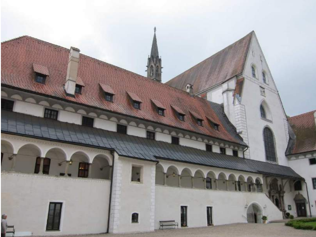
Abbildung 51: Gaming, ehemalige Kartause, Prälathof, Osttrakt und Kirchenfassade, Ansicht von Westen.