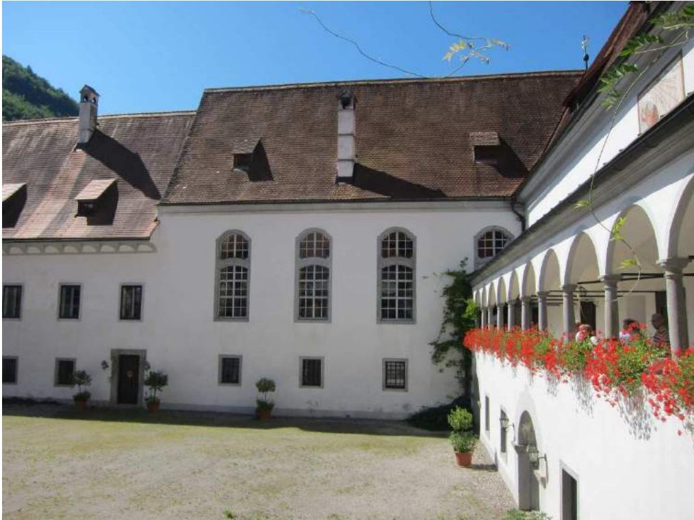
Abbildung 101: Gaming, ehemalige Kartause, Bibliothekshof, Süd- und Westtrakt.