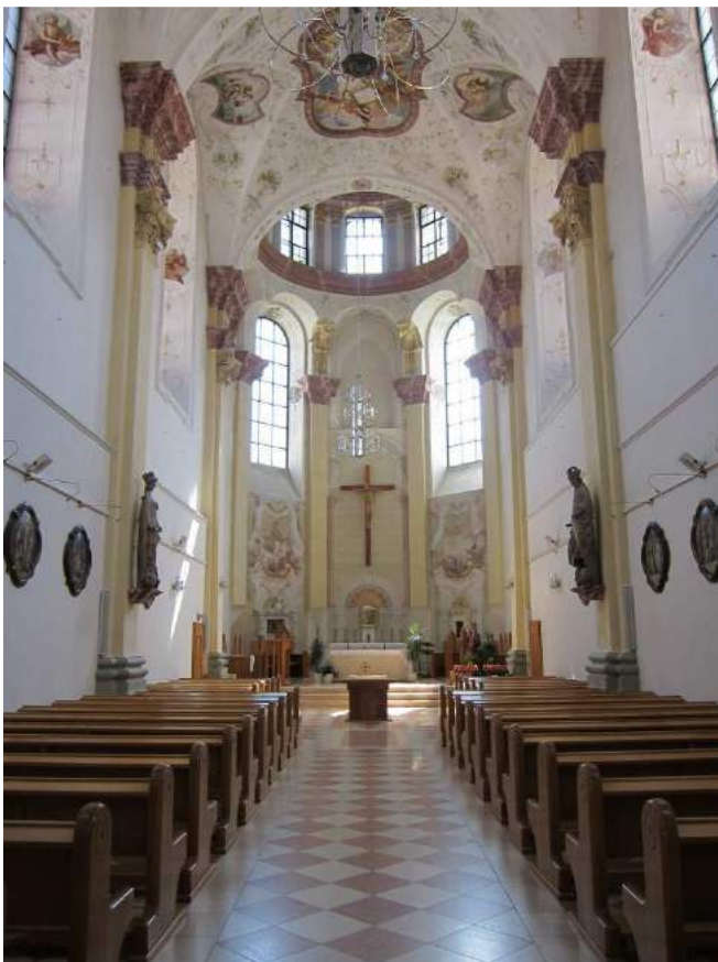
Abbildung 69: Gaming, ehemalige Kartause, Kirche, innen, Blick von Westen.