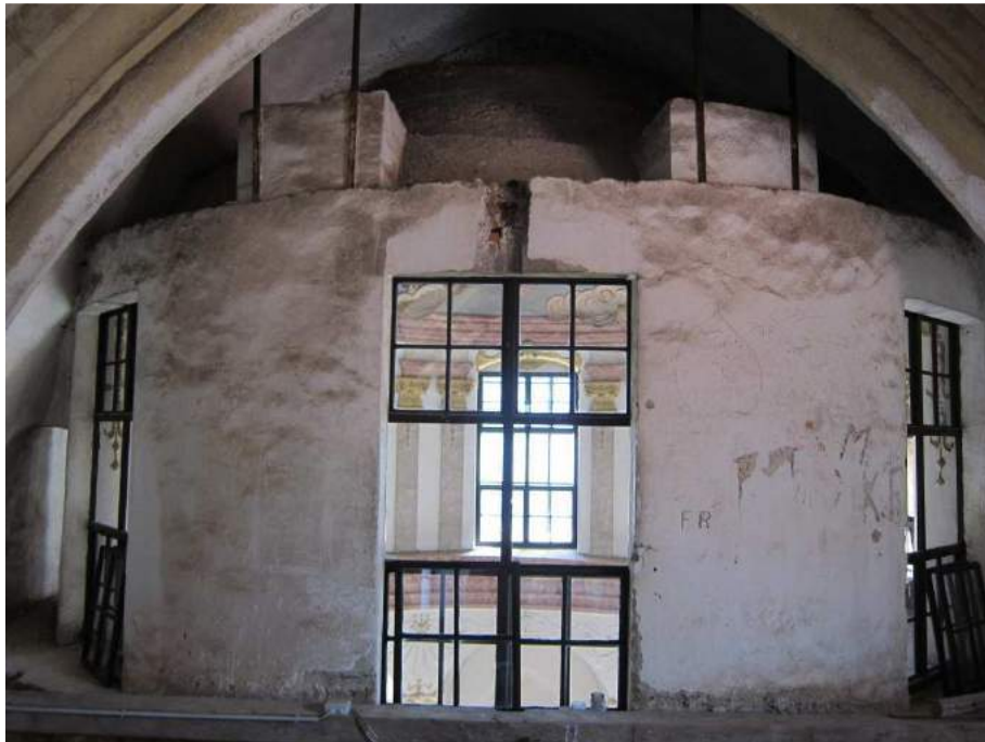
Abbildung 84: Gaming, ehemalige Kartause, Kirche, Zwischengewölbe, Tambour der Kuppel, Blick von Westen.