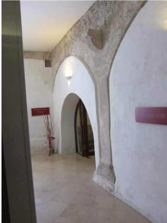
Abbildung 58: Gaming, ehemalige Kartause, Prälatenhof, Osttrakt, Ostseite innen, Bogenreste und Konsole.