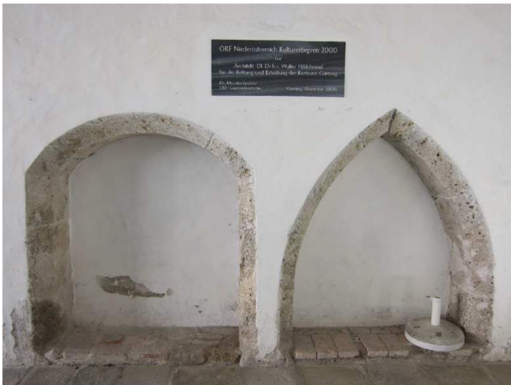
Abbildung 53: Gaming, ehemalige Kartause, Prälatenhof, Durchfahrt im Westen, Sitznischen an der Nordwand.