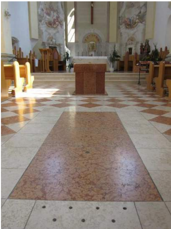
Abbildung 73: Gaming, ehemalige Kartause, Kirche, innen, Abgang zur Krypta und Kenotaph, Blick von Westen.