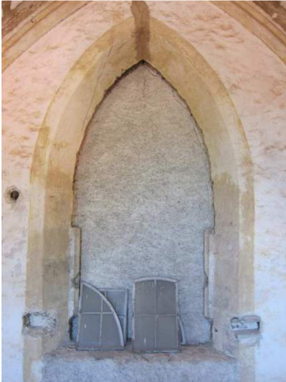
Abbildung 82: Gaming, ehemalige Kartause, Kirche, Zwischengewölbe, südliche Langhauswand, 2. Joch von Westen, vermaueretes spitzbogiges Portal.