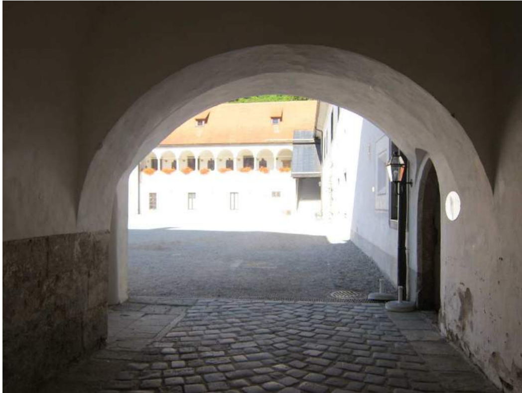
Abbildung 52: Gaming, ehemalige Kartause, Prälatenhof, Durchfahrt im Westen, Ansicht von Osten.