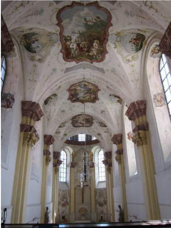
Abbildung 70: Gaming, ehemalige Kartause, Kirche, innen, Blick von der Empor nach Osten.