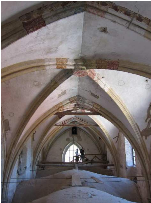
Abbildung 74: Gaming, ehemalige Kartause, Kirche, Zwischengewölbe, Blick von Osten.