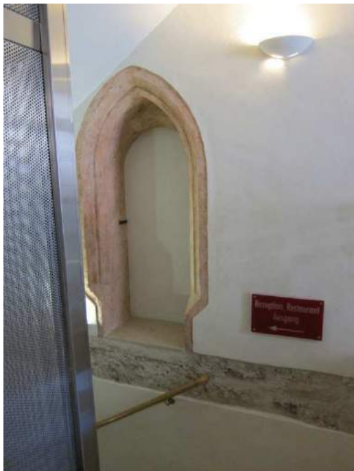
Abbildung 57: Gaming, ehemalige Kartause, Prälatenhof, Osttrakt, innen, Türrahmung im Süden angrenzend an die Kirche.