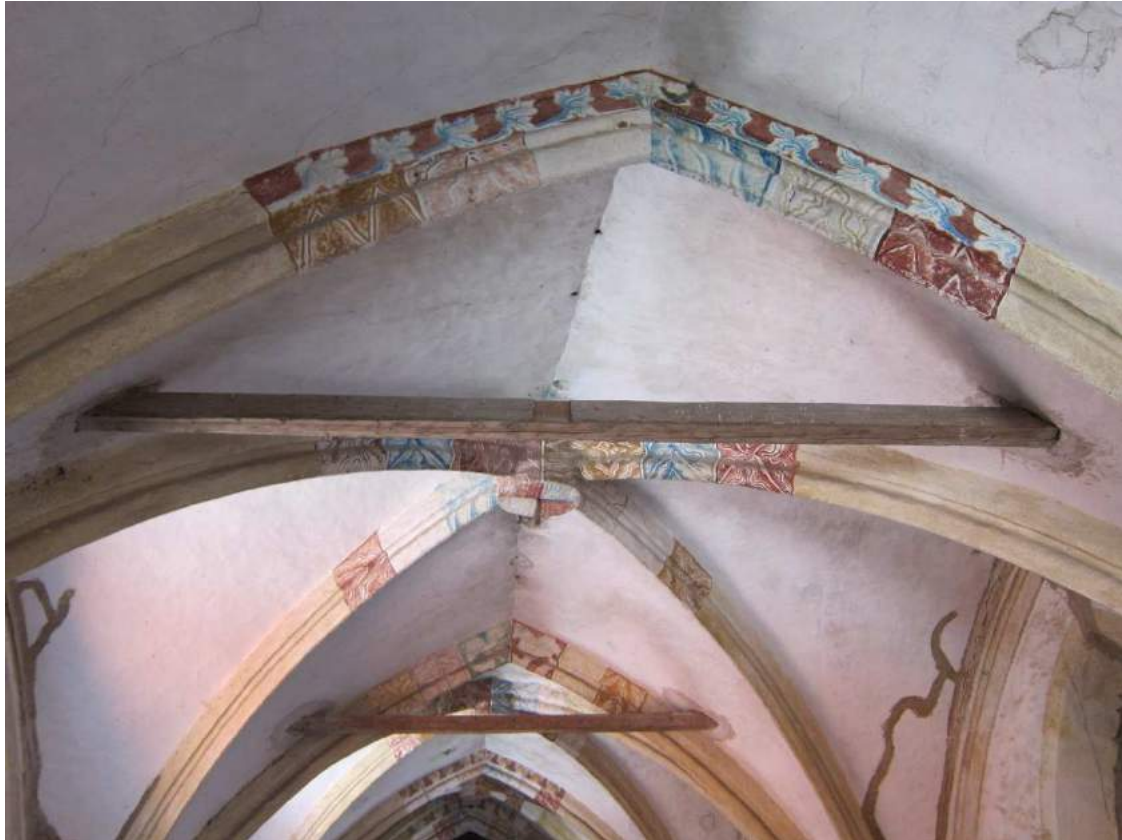
Abbildung 78: Gaming, ehemalige Kartause, Kirche, Zwischengewölbe, Blick in das 3. Joch von Westen, Schlussstein mit herabhängendem Eisenstab.