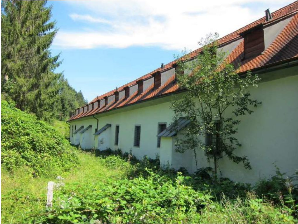
Abbildung 66: Gaming, ehemalige Kartause, Prälatenhof, Westtrakt, Westfassade mit Strebepfeilern, Blick von Westen.