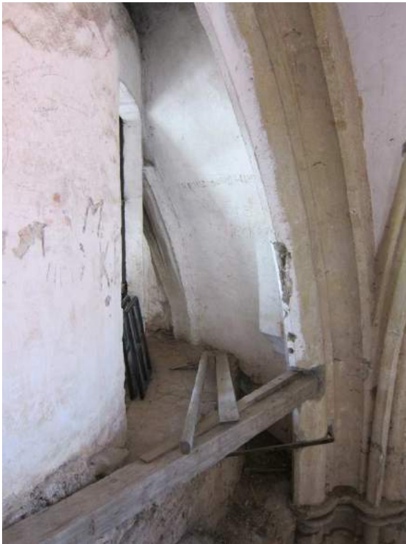
Abbildung 80: Gaming, ehemalige Kartause, Kirche, Zwischengewölbe, Tambour der Kuppel und kräftiger Scheidbogen, Blick von Nordwesten.