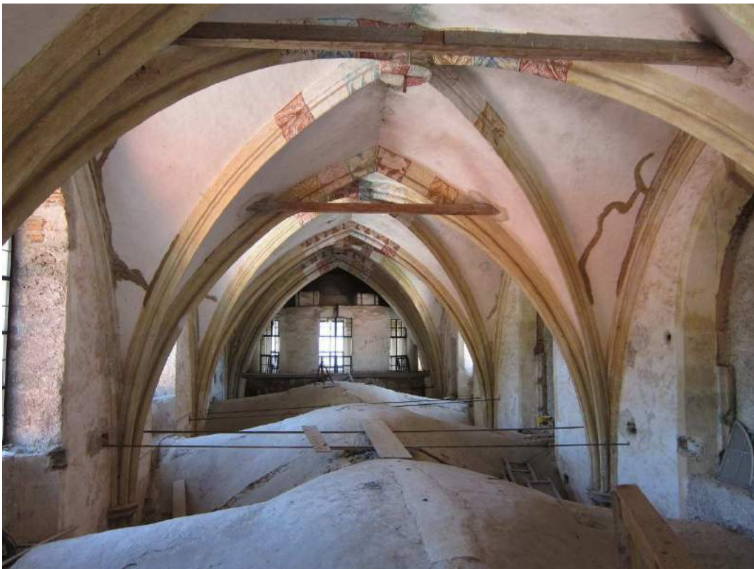
Abbildung 75: Gaming, ehemalige Kartause, Kirche, Zwischengewölbe, Blick Westen.