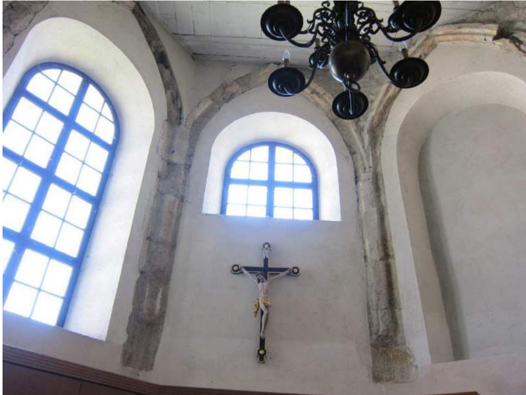
Abbildung 86: Gaming, ehemalige Kartause, Kirche, Nordkapelle, Erdgeschoß, innen, Apsis, Rippenfragmente, Blick von Westen.