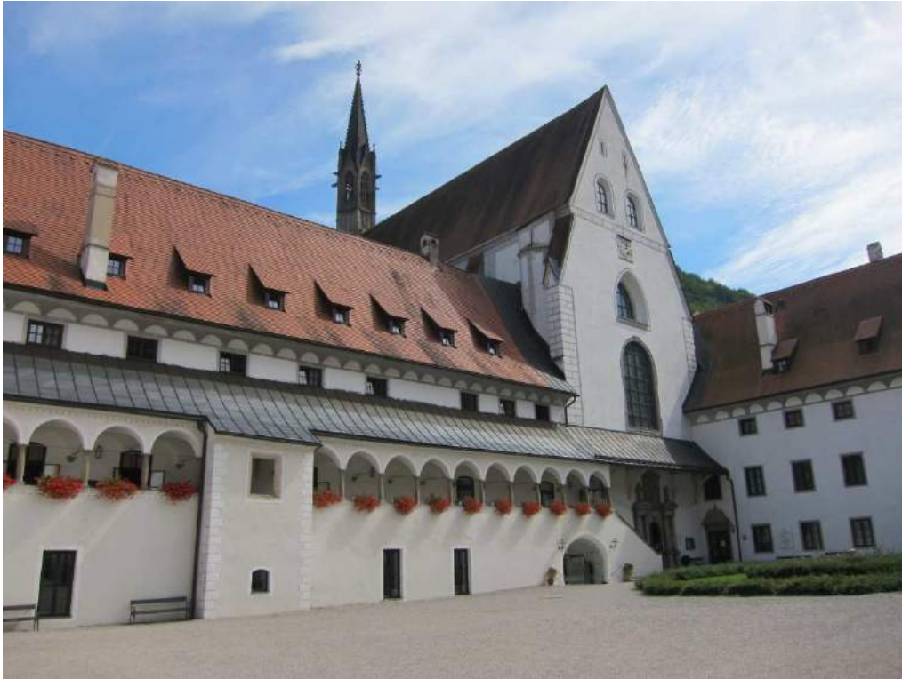
Abbildung 48: Gaming, ehemalige Kartause, Prälathof, Westtrakt, Kirchenfassade und Südtrakt, Ansicht von Nordwesten.