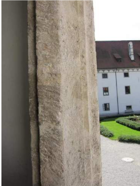
Abbildung 62: Gaming, ehemalige Kartause, Prälatenhof, Osttrakt, risalitartiger Vorsprung, Fensterrahmung im Obergeschoß.