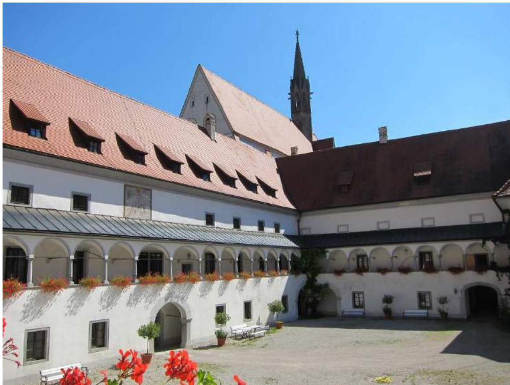
Abbildung 99: Gaming, ehemalige Kartause, Bibliothekshof, Nord- und Osttrakt, Blick von Südwesten.