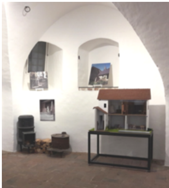
Salle 2 : les chartreux

→ ältere Veröffentlichungen; → kommende Veröffentlichungen; → sonstige Angaben über laufende Projekte oder Veranstaltungen; → ein Abschnitt "Varia" mit kurzen Texten über die Kartäuser (Werke, Meditationen über den Orden, literarische Texte ...).