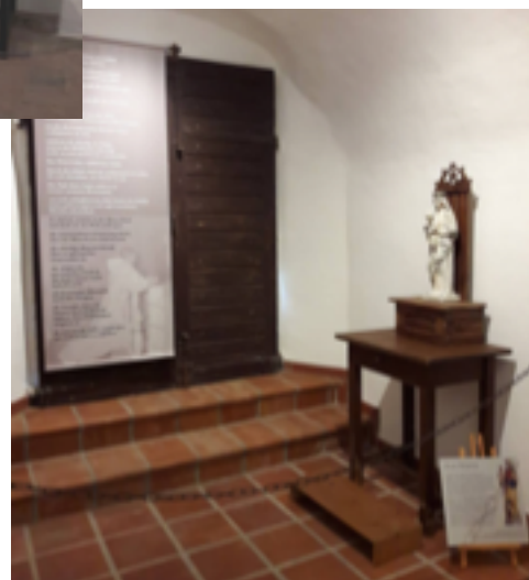
La cellule : Ave Maria