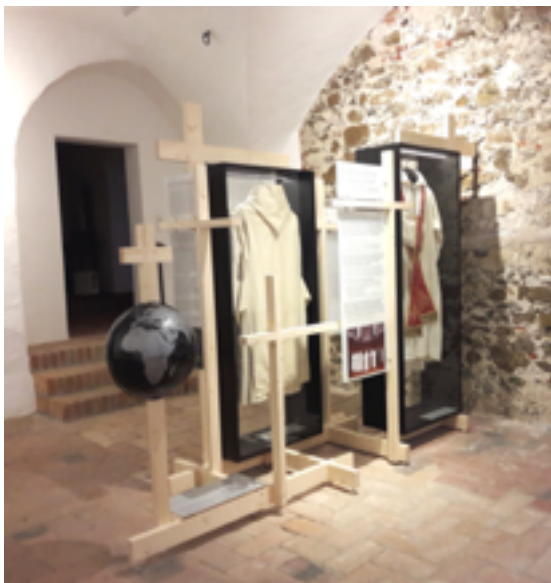
Salle 2 : les Chartreux