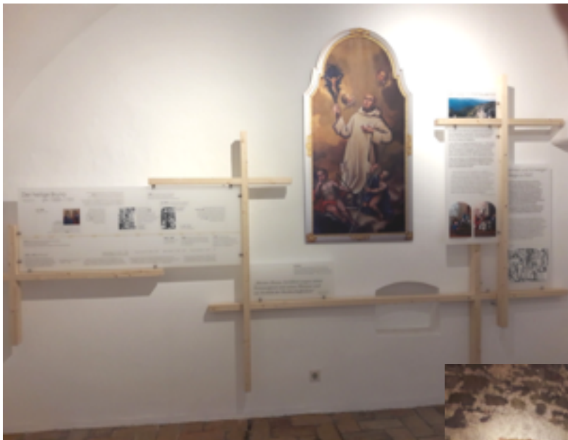
Salle 1: St. Bruno