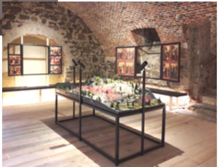
Salle 3 : la chartreuse d'Aggsbach (avec la maquette)