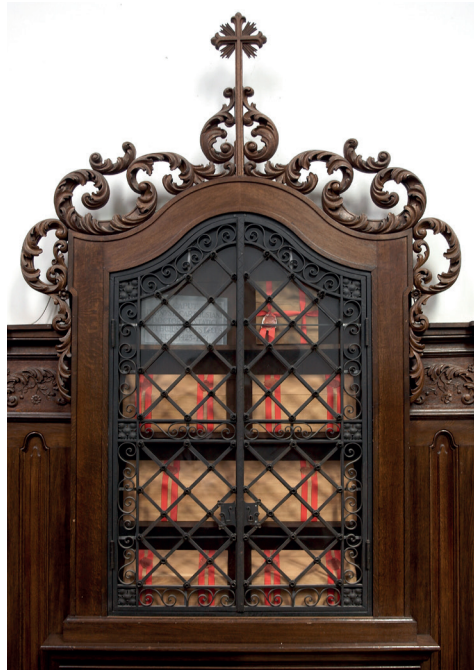
De relieken van Dionysius in de kerk van het voormalige kartuizerklooster in Roermond.

ten heeft priester te worden. Ter gelegenheid van het heuglijke feit dat deze kanunnik over twee weken zijn eerste mis zou gaan celebreren, droeg Dionysius dit werk aan hem op. 55 Hij verwees hierin naar een twaalf jaar eerder aan deze kanunnik opgedragen werk van zijn hand, getiteld De arcta via salutis ac contemptu