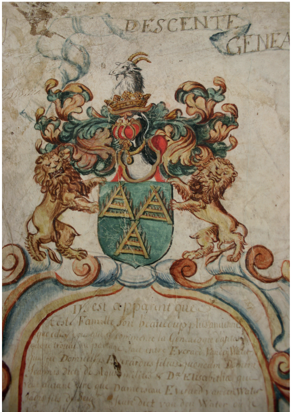
Wapen van de familie Van de Water: drie gouden eggen op een veld van groen, 1677. BHIC, 231 Collatoren beurzenstichting Petrus van de Water, inv.nr. 127F