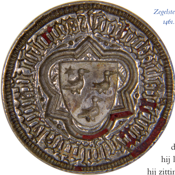
Zegelstempel van Art Stamelaert, schepen van 's-Hertogenbosch, 1461. Collectie Het Noordbrabants Museum, nr. 00996a

bekleedde hij in 1461/62. 18 Deze handelaar had vele contacten, ook buiten de stad, en was niet onbemiddeld. Hij bezat veel onroerend goed en zakelijke rechten. Hij was leenman van de hertog van Brabant, onder meer voor een huis in Son en voor delen van tienden in Hilvarenbeek en Drunen. 19 Voor een derde deel van de tiend van Berghem bij Oss was hij leenman van de abt van Echternach en had hij zitting in diens leengerecht. 20