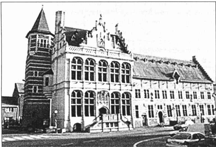
De lakenhalle in Zoutleeuw.

Diesterse lakenkooplui er moesten opboksen tegen andere kapers op de kust. Ook hebben we met betrekking tot de jaren tachtig van de 15 de eeuw kunnen vast stellen dat de omzet van de lakenexport van Diest te Bergen-op-Zoom slechts een bescheiden fractie vertegenwoordigde van de omzet in de grote metropool Antwerpen. Ten laatste blijkt dat de uitgesproken neergang van de stedelijke lakennijverheid te Diest in de loop van de 15 de eeuw geenszins een reden was om vroegtijdig te verzaken aan het structurele voordeel dat de eigen lakenhallen te Antwerpen en te Bergen-op-Zoom boden aan de stad Diest. Dit vermoedelijk omdat de stad Diest op het einde van de middeleeuwen tot het besef was gekomen dat de monocultuur van het wollen laken niet langer vol te houden was, en een geïnstitutionaliseerde vorm van permanente aanwezigheid in internationale marktcentra ook van nut kon zijn voor de producten van de industriële diversificatie die zich voortaan meer dan ooit opdrong.