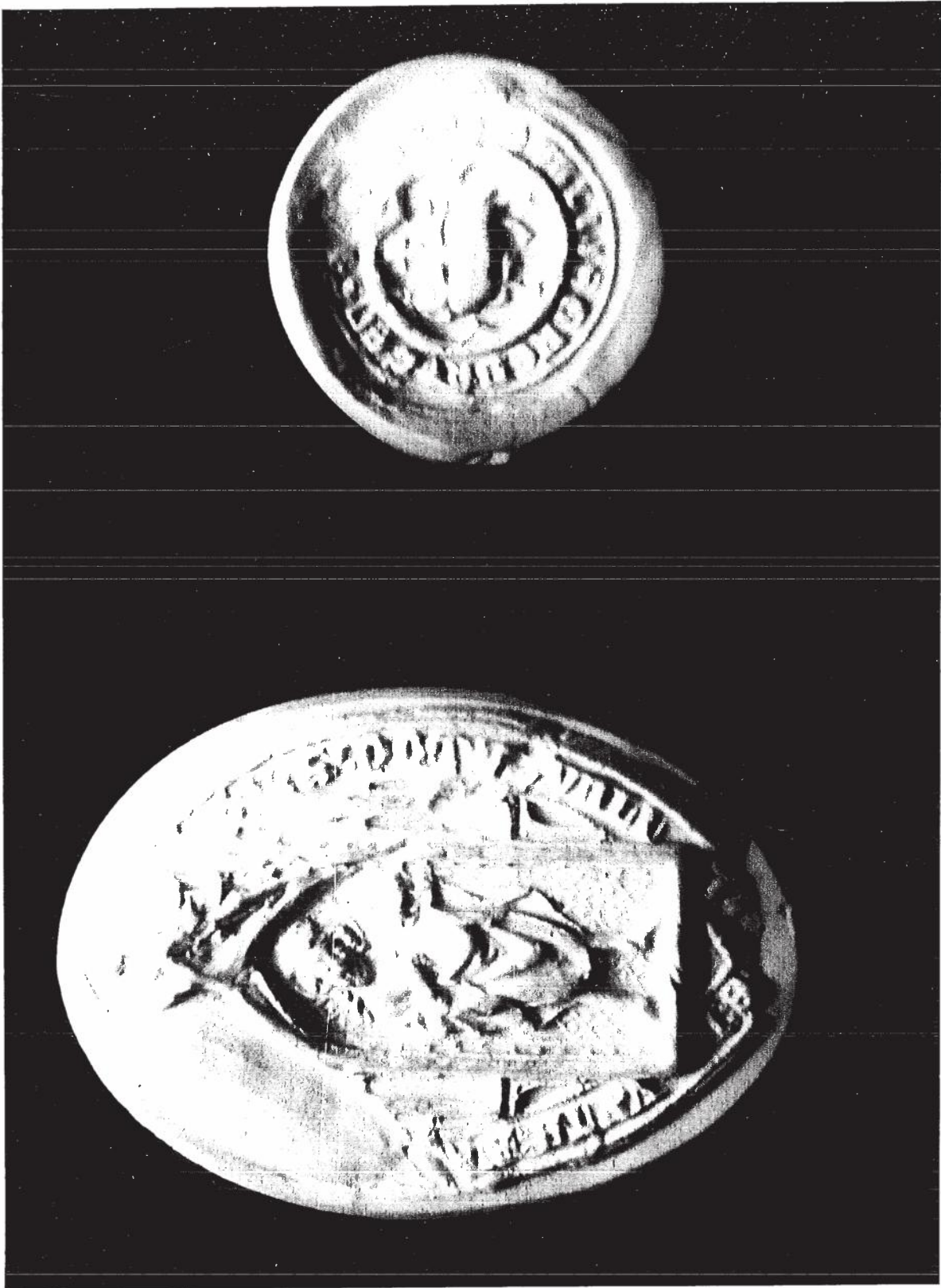
Foto van het zegel van Genadedal.