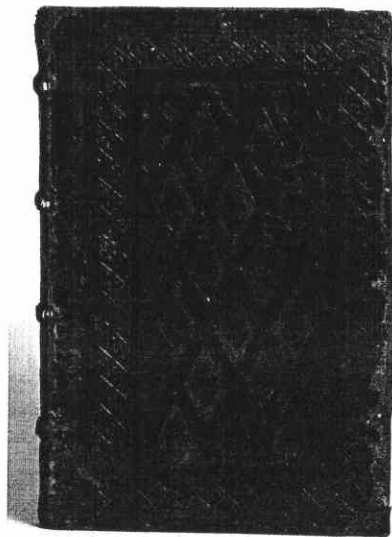
Voorplat van het handschrift met het Speculum peccatoris van Dionysius de Kartuizer in het bezit van de Provinciale Bibliotheek Limburg

Speculum peccatoris per modum Dyalogi editum per religiosissimu[m] viru[m] Dionysium Rikel Ordinis Carthusien[is] ac sacre theologie professoris. Ingedeeld in 12 artikels: een inleidend artikel en de artikels genummerd 1 tot en met 11.