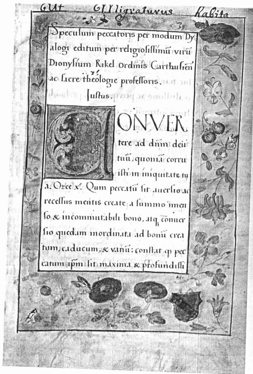
Titelbladzijde van het handschrift met het Speculum peccatoris van Dionysius de Kartuiser in het bezit van de Provinciale Bibliotheek Limburg