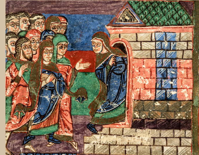
Poitiers, Médiathèque François-Mitterrand, Ms. 250, La Vie de sainte Radegonde par Venance Fortunat, v. 1100, fol. 31v (détail)